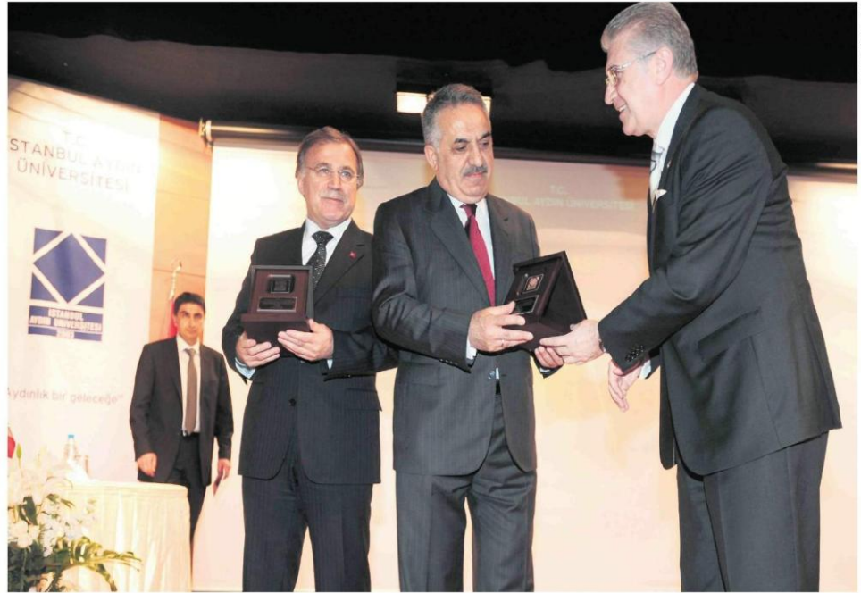
Justice Minister Mehmet Ali Şahin (L) said Turkish democracy is now stronger, at an international symposium on deliberative democracy yesterday.

He also said deliberative democracy has been a hot topic in recent days since the sole concept of democracy in the world has become "hollow." The reasons for this, he said, is that norms of the